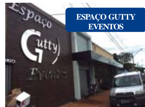
ESPAÇO GUTY EVENTOS