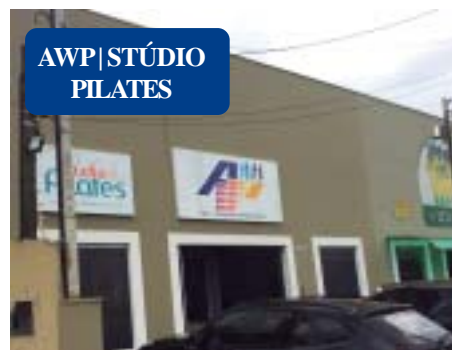
AWP | STÚDIO PILATES