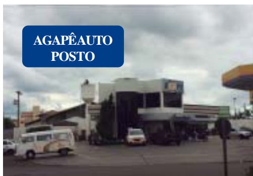
AGAPÊ AUTO POSTO