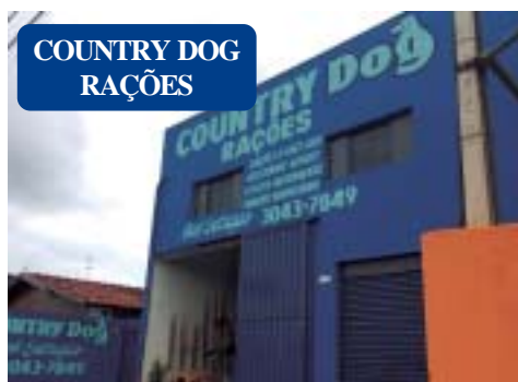
COUNTRY DOG RAÇÕES