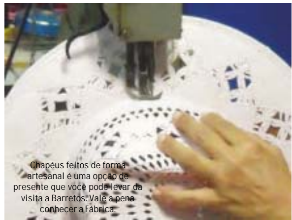
Chapéus feitos de forma artesanal é uma opção de presente que você pode levar da visita a Barretos. Vale a pena conhecer a Fábrica.

A produção artesanal pode ser encontrada em lojas de souvenir espalhadas pela cidade e em pontos de vendas nos atrativos turísticos. Uma opção que não pode deixar de ser visitada é a fábrica artesanal de chapéus.