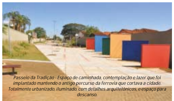
Passeio da Tradição - Espaço de caminhada, contemplação e lazer que foi implantado mantendo o antigo percurso da ferrovia que cortava a cidade. Totalmente urbanizado, iluminado, com detalhes arquitetônicos, e espaço para descanso.