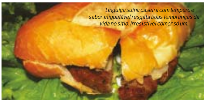
Linguiça suína caseira com tempero e sabor inigualável resgata boas lembranças da vida no sítio. Irresistível comer só um.

Saborear comida típica do interior é muito mais que sabor, é recordar os bons tempos, se fartar sem pressa e apreciar cada pedacinho que vai à boca e perceber as delícias do saber comer bem. Para aqueles que querem apreciar os pratos típicos da gastronomia local o mais pedido é a Queima do Alho, com toda a cultura tropeira incluída desde os ingredientes, do modo de preparo e apresentação visual. Além disso, os drinks especiais e sorvetes refrescantes para apaziguar o calor de Barretos merecem ser experimentados.