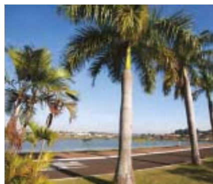
Região dos Lagos - A Região dos Lagos é excelente para atividades físicas ao ar livre, com pista de caminhada, academia ao ar livre, quiosques com água de coco e ainda é possível pescar.