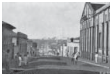
Foto do Cine Santo Antônio na década de 1910.

Em 1966, Jorge Andrade teve a sua peça “A moratória”, encenada por professores e alunos do Ginásio Estadual Vocacional. A peça foi dirigida pelo próprio autor e apresentada no “Grêmio Literário e Recreativo de Barretos”.