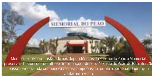
Memorial do Peão - Instalado nas dependências do Parque do Peão o Memorial preserva a história, os detalhes e informações desde a 1ª Festa do Peão de Barretos. No passeio você ainda conhecerá vários campeões de rodeio e personalidades que visitaram a Festa.

A cidade é rica em entretenimento e atividades durante o dia, ao entardecer e à noite, seja ele passeio cultural, ao ar livre ou se divertir com compras e lazer. Passear pelo centro da cidade é desfrutar de todas as facilidades do centro comercial, agências bancárias e outros serviços. A Rua 43 é o point mais badalado na época da Festa do Peão, onde se concentra diversos estabelecimentos especializados em moda country. A seguir são ilustradas as principais opções de passeios.