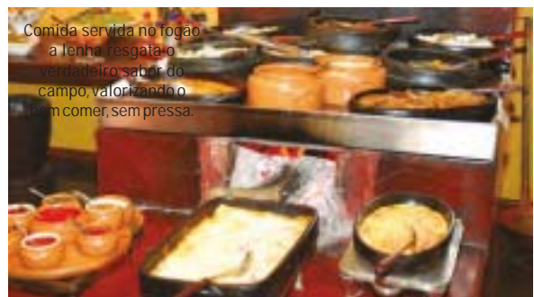
Comida servida no fogão a lenha resgata o verdadeiro sabor do campo, valorizando o bem comer sem pressa.