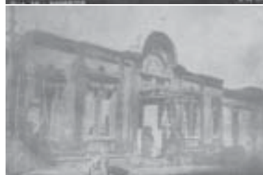
Cine Éden após o incêndio.