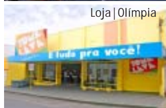
Loja | Olímpia