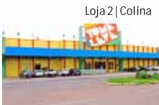
Loja 2 | Colina