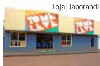
Loja | Jaborandi