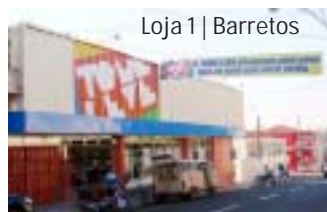
Loja 1 | Barretos