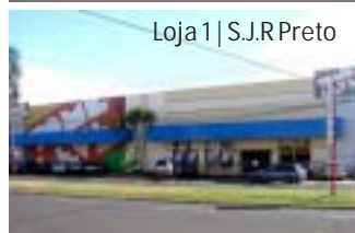
Loja 1 | S.J.R. Preto