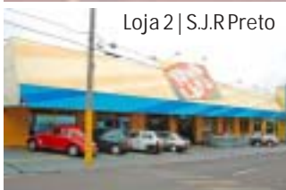
Loja 2 | S.J.R. Preto