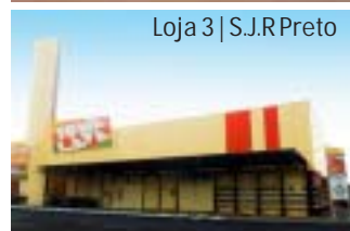
Loja 3 | S.J.R. Preto