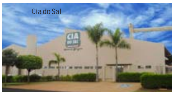
Cia do Sal

Apoiando o desenvolvimento industrial de Barretos, a cidade conta com 2 Distritos Industriais, dotados de completa infraestrutura - água, resgoto, energia, asfalto e telefonia.