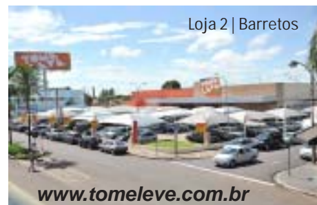
Loja 2 | Barretos

Para conhecer um pouco mais sobre essa Rede de sucesso, acesse: