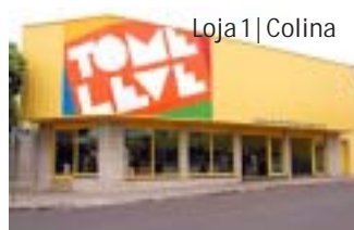
Loja 1 | Colina