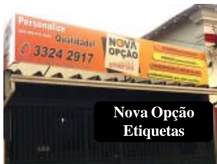
Nova Opção Etiquetas