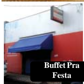
Buffet Pra Festa