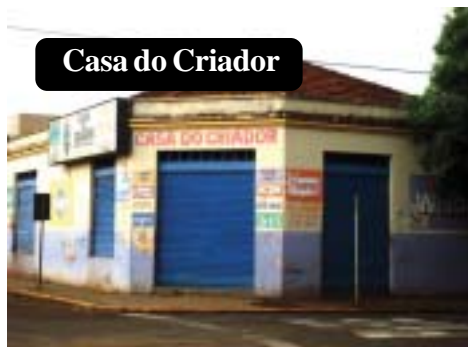
Casa do Criador