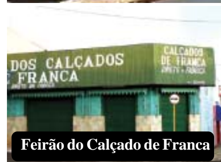
Feirão do Calçado de Franca